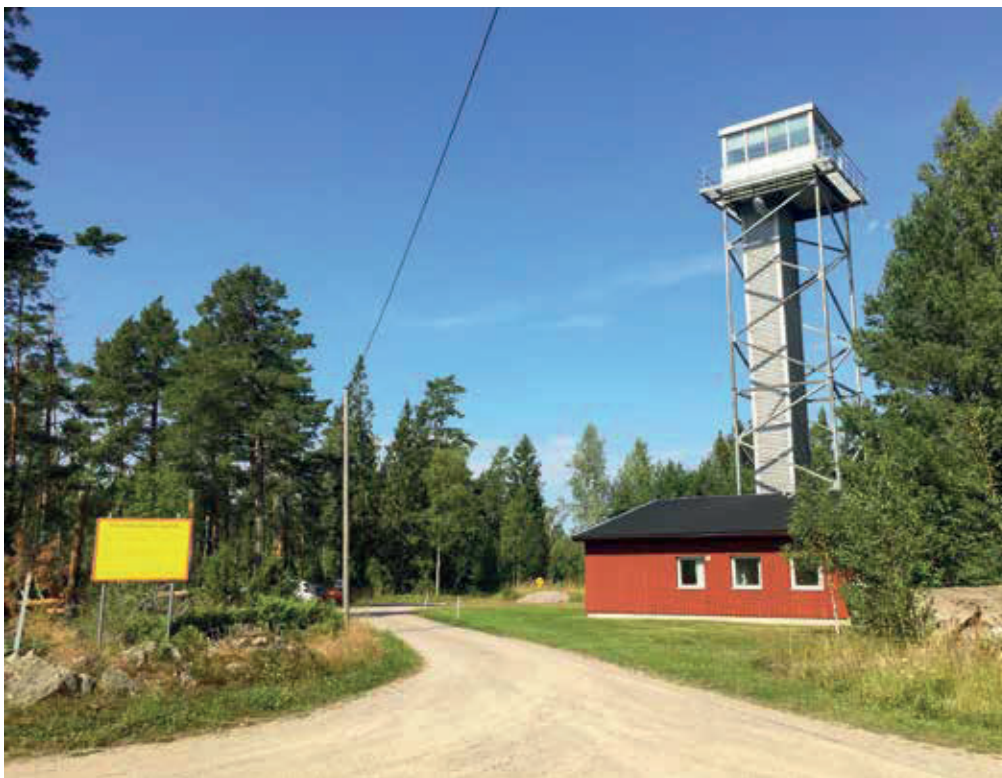
Infarten till smultronstället Rossholm med det gamla militära tornet.