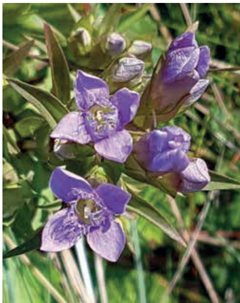
Fältgentiana ( Gentianella campestris )

Alla ni som bara far förbi Rossholm, stanna upp och ta del av detta smultronställe med promenadstigar och utsiktsplatser! Vem vet, ni kanske träffar på Barbro som kan ge tips om bästa skådarplatsen eller var man kan hitta större vattensalamander, fältgentiana eller bastardsvärmare.