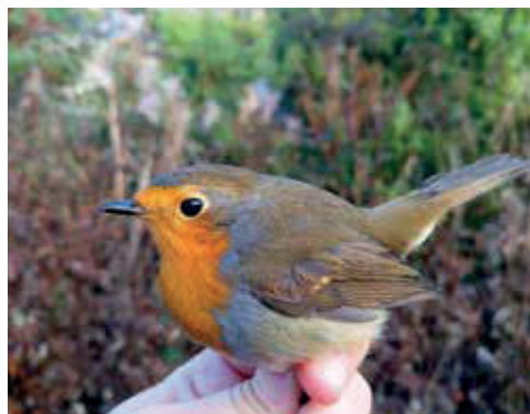
En rödhake ( Erithacus rubecula ) ringmärks på Svenska Högarna 19 september 2016.