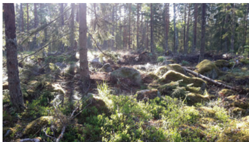
Kl. 06:58, paus med ångande mossa

och under 5 minuter vid var och en av de 8 punkterna. Inte så svårt. Utmaningen består i att hitta i skogen, men GPS:en är en bra hjälp – pilen på skärmen visar om jag håller rätt kurs mot nästa punkt. Hur hade jag gjort för 20 år sedan? Ibland är det lätt att gå, genom gles skog, ibland blir det tätare. Det finns diken, och ett brett dike ställer till det. Det är alldeles för långt för att ta sig runt. Som tur är hittar jag flera nedfällna träd som korsar diket och vid en plats ligger två träd på ett sätt så att jag kan klättra på den ena och hålla fast i den andra. Så lyckas jag ta mig över diket med inte alltför stor omväg och jag letar mig tillbaka till min linje på vägen till punkt 3. Här är det fint. Solen börjar klättra upp bakom träden och spindelväv glittrar av dagg i motljuset. I en trädtopp sjunger en