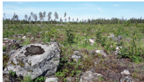
Kl. 08:55 på ett hygge