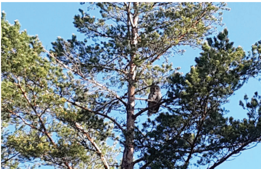
Kl. 07:15, slagugglan efter attacken

skymtar jag en torraka som mycket möjligt kan vara platsen för boet. Jag går raskt fram och förbi torrakan och ugglan. Nu verkar det som jag kommit förbi. Ugglan sitter uppe i ett träd och tittar på mig men gör inga fler anfall. Puh! Torrakan med boet råkade stå lite för nära min förbestämde linje. Kul att stöta på en slaguggla, men det kunde lätt ha gått illa. Jag har hört om halvt avrivna öron och klomärken i ansiktet. De som märker slaguggleungar utrustar sig med skyddshjälm! Men jag har haft tur. Ugglan träffade mig i nacken där luvan av min huvtröja skyddade min hals. Fick ett par lätta rivmärken bara. Nästa gång ska jag vara bättre förberedd!