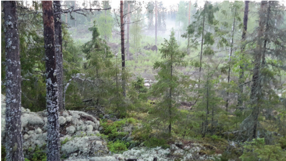
Kl. 04:14 längs linje 1, 05:08 och 05:41 någonstans mitt i skogen

Men det är också det som är tjusningen – jag ska ta mig ut till några platser som jag annars aldrig hade uppsökt. Det är inga utflyktsmål som lockar, inga vägar som leder dit, inget särskilt jag letar efter, ingen särskild fågel heller – mitt uppdrag lyder helt enkelt att räkna alla fåglar när jag går längs ruttens kantlinjer och på ruttens 8 punkter.