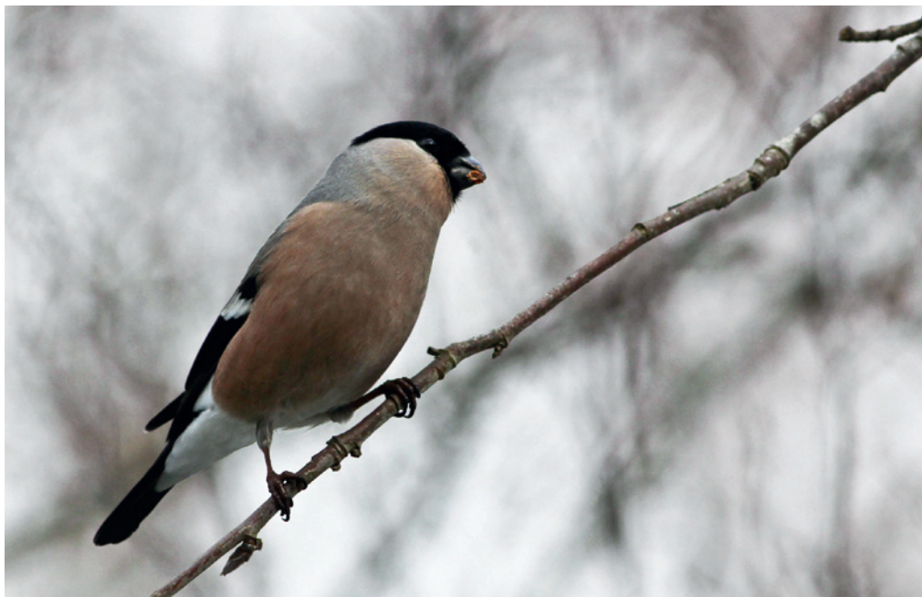
Adult hona av domherre ( Pyrrhula pyrrhula ).

Vi har även en sedvanlig fågelmatning på tomten, men menyn – solrosfrön och jordnötter – tycktes inte locka domherrarna vid denna tid. Jag såg dem åtminstone inte där under dessa dagar. Av allt att döma föredrog de rönnbär. Även om de för tillfället gjorde det, råder det inga tvivel om att domherrarna gärna besöker de fågelmatningar som vi människor dukar upp åt dessa våra bevingade vänner. De flesta som har ett fågelbord har säkerligen någon gång haft besök av denna vackra och trevliga fågelart.