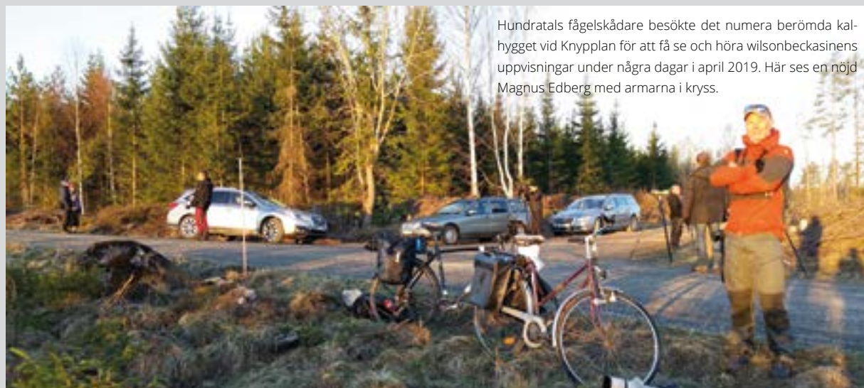
Hundratals fågelskådare besökte det numera berömda kalhygget vid Knyppplan för att få se och höra wilsonbeckasinens uppvisningar under några dagar i april 2019. Här ses en nöjd Magnus Edberg med armarna i kryss.