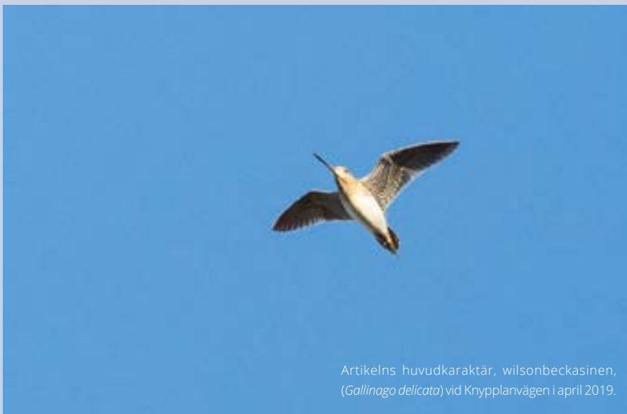
Artikelns huvudkaraktär, wilsonbeckasinen, ( Gallinago delicata ) vid Knyppplanvägen i april 2019.

British Birds, 101, April 2008, s. 189-200