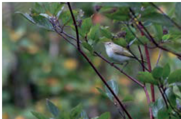
Berg-/balkansångaren på jakt efter bladlöss i videokornell.

började genast ana vad jag hade framför mig, även om jag knappt vågade tro på det, så jag skyndade iväg för att hämta sambon som för tillfället höll på med garagestädning.