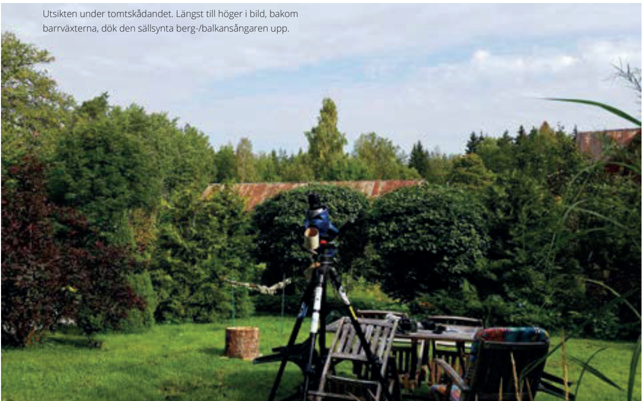
Utsikten under tomtskådandet. Längst till höger i bild, bakom barrväxterna, dök den sällsynta berg-/balkansångaren upp.