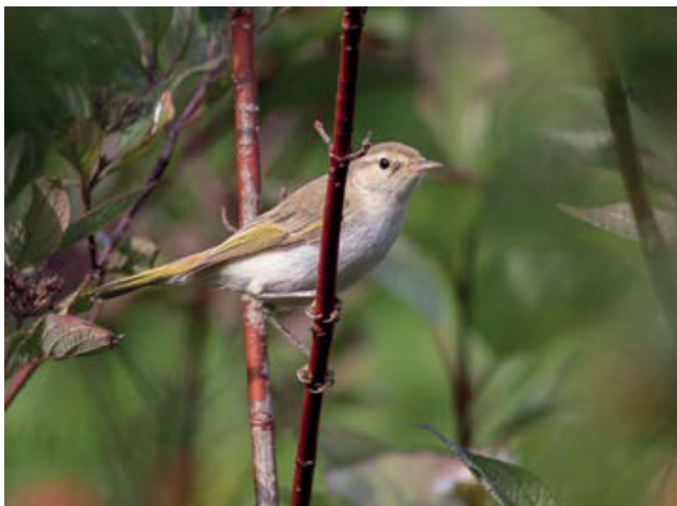
Berg- eller balkansångare, Phylloscopus bonelli/orientalis , Mumsarby 8 september 2018

Lördagen den 8 september var det dags för årets upplaga av Riksmästerskapet i tomtskådning. Det är en kul tävling, där äran och de egna upplevelserna är enda priset, och jag brukar vara med mest för att jag tycker det är ett bra tillfälle att se vad ens egen tomt kan ge under en hel dag. För några år sen sträckte en större strandpipare förbi i gryningen och förra året kom två kustlabbar över tomten under pågående mästerskap, så i år hade jag känslan att vad som helst kan hända under Riksmästerskapet i tomtskådning.