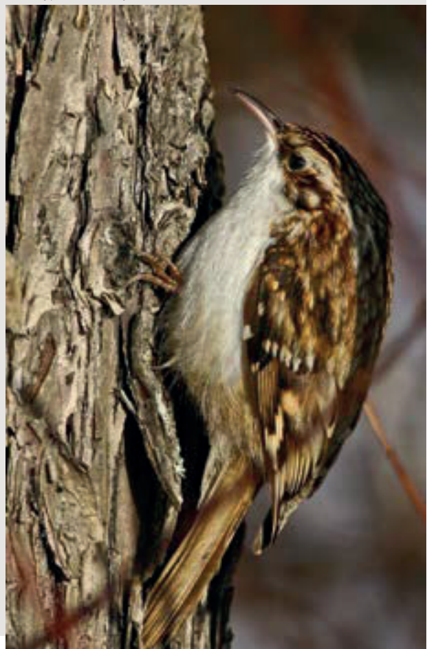
Trädkrypare, Certhia familiaris .

Något som möjligen talar mot detta antagande är att ett av de två återstående återfynden är från Eggegrund, utanför kusten i Gästrikland, efter fyra dagar. Dit är det ungefär 18 mil och rimligtvis kan fågeln inte ha flugit dit över havet. Den måste till stor del ha flugit över land i Uppland. Trots detta hade den hamnat där. Vi har för övrigt kontrollerat en trädkrypare ringmärkt på Hartsö-Enskär, en ö utanför Södermanlandskusten, fyra dagar