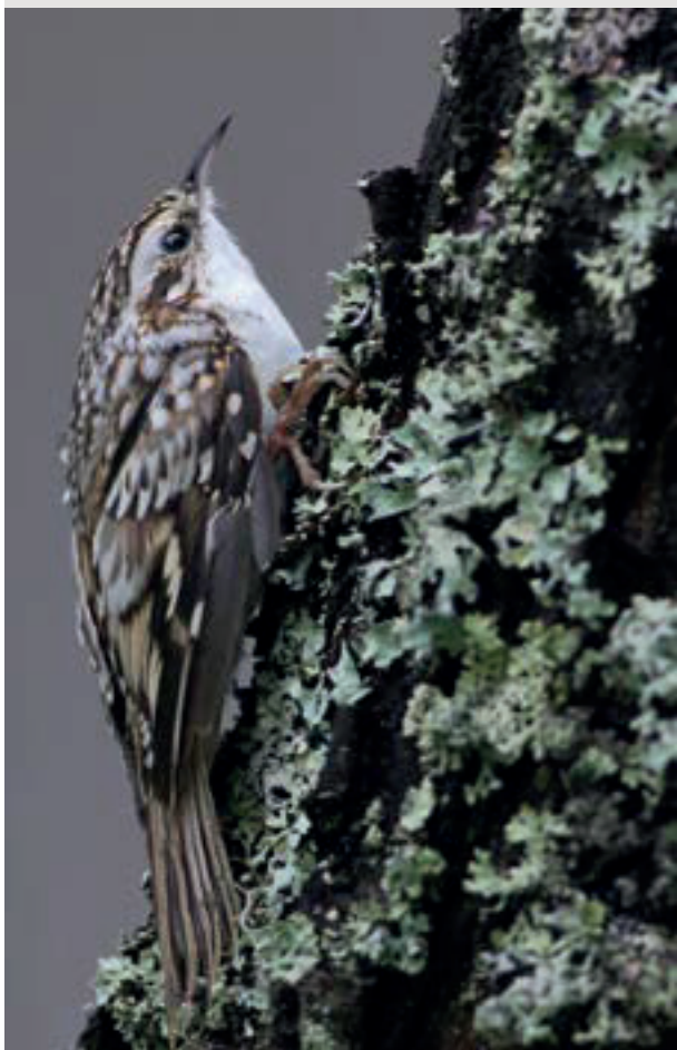
Trädkrypare, Certhia familiaris .

Att det kan vara förvånansvärt många som är på vandring kan dock utronas på en ö där det förekommer regelbunden fångst av fåglar för ringmärkning. På Svenska Högarna har ringmärkning av rastande fåglar ägt rum varje höst sedan 1976 och här fångas arten varje höst. Även om antalen varierar stort från höst till höst är den ändå så pass vanligt förekommande att den är den sjunde (!) talrikaste arten i ringmärkningsprotokollen under denna årstid. Det är något som förvånar alla utan erfarenhet av ringmärkning i ytterskärgården.