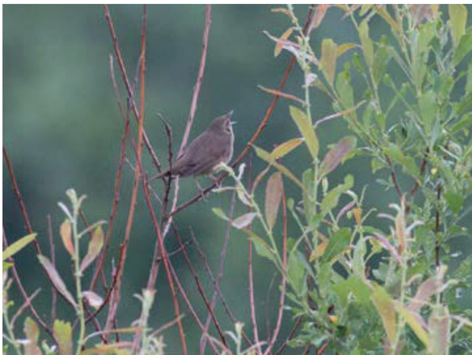
Flodsångaren fortsatte sjunga ihärdigt under hela det timslånga besöket hos den.

Inte stött på någon liknande individ förr. Superintressant.