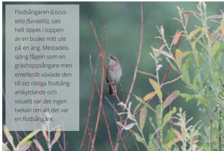
Flodsångaren ( Locustella fluviatilis ), satt helt öppet i toppen av en buske mitt ute på en äng. Mestadels sjöng fågeln som en gräshoppssångare men emellanåt växlade den till sitt riktiga flodsångarskyttlande och visuellt var det ingen tvekan om att det var en flodsångare.

och jag kunde då visuellt konstatera att det faktiskt var en flodsångare och inget annat. Nu gällde det bara att försöka få bilder på den också och att försöka spela in sången. Att smyga sig nära en fågel som sitter i en buske mitt ute på öppen mark är inte det lättaste, så jag använde mig av en teknik jag utvecklat under mitt jobb med stenskvättor. Jag har lärt mig att det i regel aldrig går särskilt bra att gå rakt emot en fågel för då blir den rädd och sticker snart iväg. Istället rör jag mig i sidled. Så här gick jag i sicksack för att sakta men säkert komma allt närmare busken där flodsångaren satt. Jag rörde mig sakta och jag stannade ofta upp för att låta fågeln vänja sig vid min närvaro. Ett par gånger tystnade den och stack iväg från busken för att födosöka men den återvände hela tiden till samma buske. Efter en halvtimmes försiktigt avancerande mot busken hade jag lyckats ta mig så nära som bara 15 meter från den. När jag var så pass nära blev flodsångaren lite obekvämt och hoppade ner en våning, men den fortsatte ändå sjunga, så den blev inte så farligt störd av min närvaro. Mestadels sjöng fågeln som en gräshoppssångare, den kunde hålla på så i ett par minuter, men så växlade den snyggt till flodsångarsång, körde skyttlandet i ca 10–30