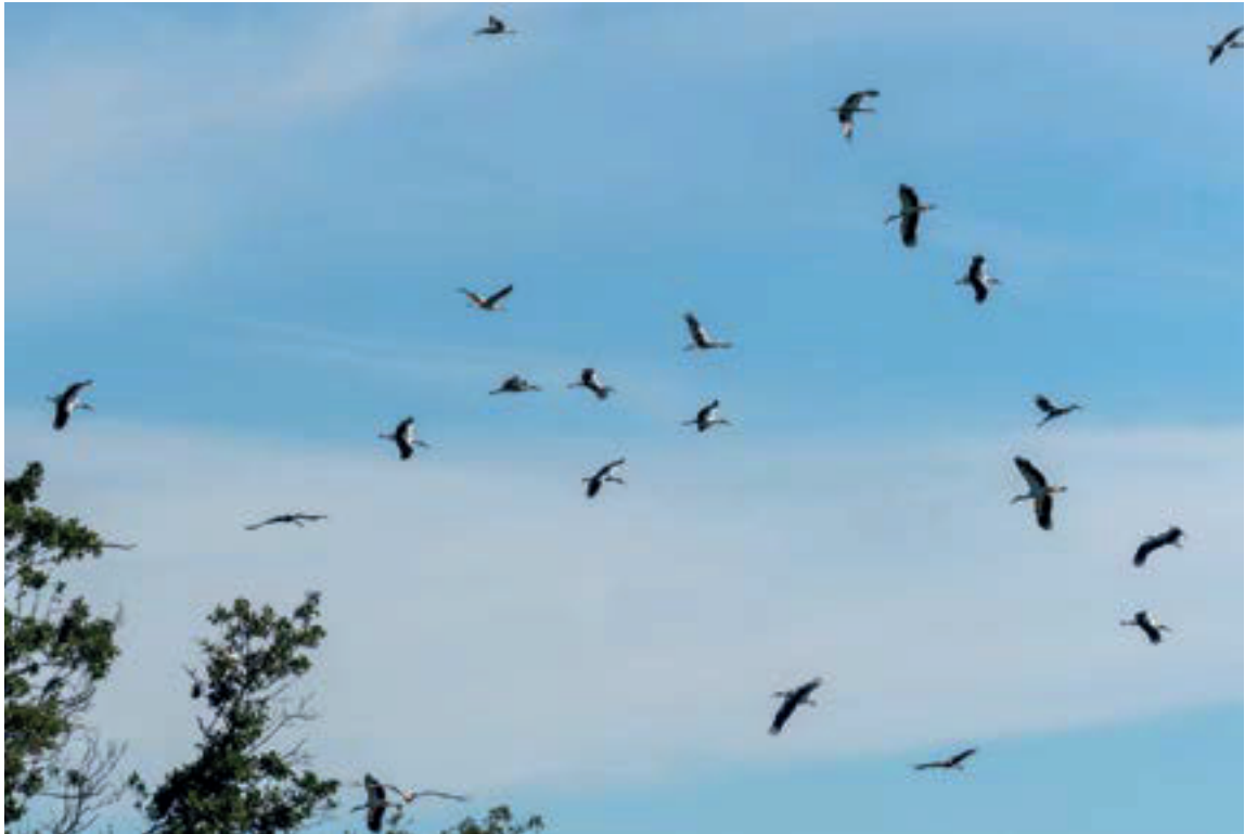
Vit stork, Ciconia ciconia , Edebo 13 augusti 2018.

12:e är hittills okänt. Eftersom det förefaller osannolikt att de skulle ha undgått uppmärksamhet under tiden där emellan kan vi kanske hoppas på ytterligare fakta kring detta framöver.