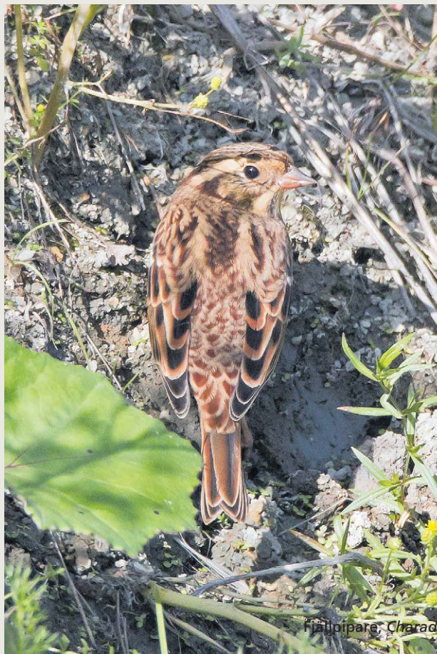
Trolig ungfågel videsparv, Emberiza rustica , Kungsängen, Uppsala 11 september 2015.

DET FÖRSTA KÄNDA fyndet av arten i landet är från Norrbotten 1821 (Sundevall 1856), men den första häckningen konstaterades i samma landskap först 1897 (Holmström m fl 1942). Av detta skall man dock inte dra slutsatsen att fyndet 1821 var ett undantag och att det var först mot slutet av detta århundrade som videsparven etablerade sig som häckfågel i Norrland. Den kan ha funnits här redan tidigare utan att ha blivit upptäckt i denna av fågelkunniga på den tiden så ringa befolkade del av landet. Eftersom arten övervintrar i Kina, berördes inte heller den södra delen av Sverige under flyttningen och det var först in på 1900-talet som videsparven började observeras i mer sydliga landskap. Även om invandringsförloppet är dåligt känt tycks det inte råda några tvivel om att videsparven under 1900-talet efterhand utvidgade sitt utbredningsområde åt söder i landet. I den första upplagan av Förteckning över Sveriges Fåglar (SOF 1949) anges: "Häcker tämligen allmänt-sparsamt, helst i sumpig barrskog, i Väster- och Norrbotten och i de lägre delarna av södra och norra Lappland. Har häckat även i Jämtland, Ångermanland, troligen i Dalarna". Därefter fortsatte arten att sprida sig söderut som häckfågel. Under 60- och 70-talen noterades de första häckningarna i till exempel Hälsingland och Gästrikland. Videsparven var av allt att döma då inne i ett expansionst skede i den södra delen av Norrland.