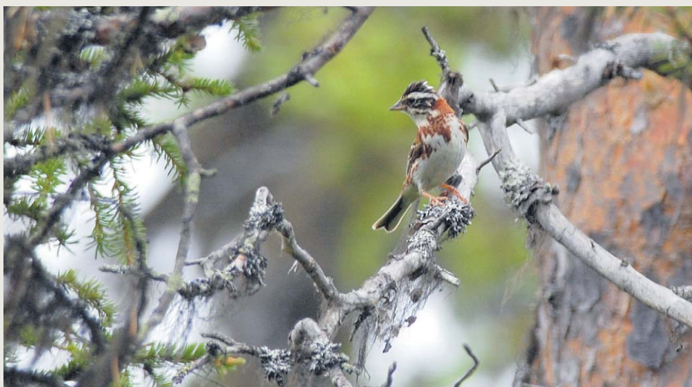
Hane videsparv, Emberiza rustica , från häckningsplats vid Skarvsjöbyn, Lycksele lappmark i juni 2013.

Under videsparvens korta historia, drygt 70 år, i den uppländska fågelfaunan, har arten hunnit med att etablera sig som häckfågel för att efter några år återgå till att endast vara en passerande flyttfågel som rastar tillfälligt i landskapet. Det första fyndet i landet gjordes i Norrbotten redan 1821 och det var också i detta landskap som den första häckningen konstaterades 1897. Att den första kända häckningen är från ett så pass sent datum behöver dock inte nödvändigtvis betyda att arten har invandrat i landet under detta århundrade. Videsparven har i och för sig ett karaktäristiskt utseende under häckningstid, men dess biotopval och levnadssätt gör den inte särskilt lätt att hitta. Den kan således ha invandrat tidigare och därmed också passerat genom Uppland redan då, utan att någon registrerat det. Hur det än är med detta kommer videsparvens hittillsvarande historia i Upplands rapportområde att presenteras nedan, men också när det är störst chans att få se den och var.