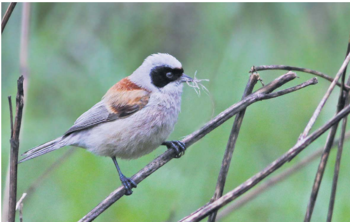
Hane pungmes, Remiz pendulinus , i bobyggartagen (dock ej individen som diskuteras i artikeln).