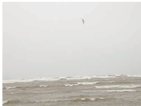
Mås- och trutspaningen resulterade i en vittrut och ett par tretåiga måsar. Bilden visar en fiskmås.

bra lä, en berglärka höll dock till på norra stranden av dammen i lä av de stora timmerhögarna. Den var mycket svår att se. Raoul hittade bra lä bakom en av timmerhögarna och stod där och spanade. Fredrik och PJ gick runt dammen (Östraviken) för att leta ytterligare berglärkor. Vid inloppet till själva hamnen upptäcktes två labbar i handkikarna och när lä hittades bakom en liten vaktkur kunde Fredrik och PJ med glädje konstatera att de just stod och tittade på en gammal och en ung bredstjärtad labb på mycket kort avstånd, 100–200 m. Samtidigt sågs två labbar längre ut, men den tilltagande snöyran just då gjorde artbestämningen omöjlig. Efter en kort rundvandring bland timret samlades alla tre igen och gick mot bilen, då en jorduggla flög upp från spånhögarna nära kusten. Vi påbörjade hemresan, som gick mycket långsammare, vid 15:30-tiden. Det hade kommit mer snö och det blev bara värre och värre med köer och halka ju närmare Uppsala vi kom.