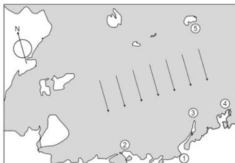
Fig.1. Gävlebukten och några kända lokaler som ligger där; Rullsand (1), Skutskärsverken (2), Billudden (3), Långsandsörarna (4) och Eggegrund (5). Pilarna visar den huvudsakliga nordliga vindriktningen mellan 08:00 och 16:00 som uppmättes på Eggegrund, den 1 november 2006.

Vi diskuterade flitigt hur klokt det var att göra denna resa i ovädret, men vi körde långsamt vidare norrut. Arter vi pratade om var på sin höjd en bredstjärtad labb (om sikten var god), tretåig mås och möjligen en berglärka inne på Skutskärsverken. Vid flera tillfällen sa PJ ”Tretåig mås måste vara en lågoddsare i det här vädret.”