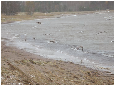
Många måsar och trutar tvingades flyga söderut över land eller landa i den hårda vinden.