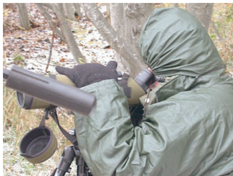
Skådning under besvärliga förhållanden. Men om man hittar en skyddad plats och kommer igång med skådandet kan det bli mycket spännande.

blåste in över land gick ner lågt längs stranden och rastade i lä, antingen i vattnet (c) eller en bit upp på stranden vid Sör-Klyxen. Den streckade pilen (d) visar på sträckriktning för de två bredstjärtade labbarna som sågs på morgonen.