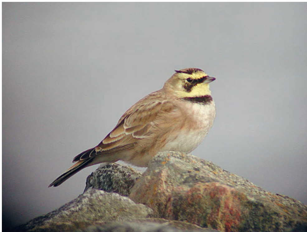
Med lite tur kan man få se en berglärka vid Biotestsjön. Det av människohand skapade udda området drar till sig lite ovanligare fåglar.

och spanar efter skärpiplärkor. Emellanåt kommer de flygande över våra huvuden och ibland födosöker de på de öar som finns ute i Biotestsjön. Det är bara att hålla ögonen och öronen öppna. Vi hade tur denna gång och såg en av dem stå ute på en av öarna i Biotesten högst upp, helt öppet och spanande omkring sig. Man är alltid tacksam för snälla fåglar. Ibland kan det vara ända upp till fyra stycken i området vintertid. På dessa öar står det också mycket storskarvar. En del med utspända vingar även på vintern vilket gör att man funderar lite om de verkligen torkar vingarna på det sättet eller vad de egentligen håller på med.