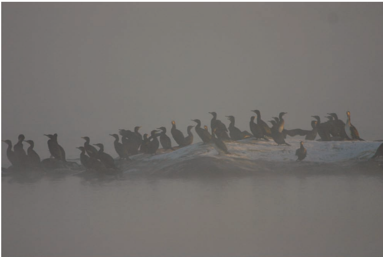
Biotestsjön håller en vattentemperatur som är ca 10 grader mer än omgivande vatten. Under vintern ger detta en fin övervintringslokal för en del fåglar. Skarvarna trivs ute på de små öarna i sjön.

dra till sig riktiga rariteter. Vägen blir nu inte lika bra men det är bara att fortsätta utefter havskanten. När man kommer fram till en delning av vägen får man ta ett beslut. Antingen cyklar man åt höger och kommer då till sälhägnet eller åt vänster och här går vägen ända ut till utloppet. Väljer man den högra vägen får man gå resten av biten ut till utloppet efter sälhägnet. Denna väg är den som Keith Bennett varmt rekommenderar eftersom man får solen från rätt håll och kan stöta på småfåglar i skogen och bland buskarna på vägen ut mot utloppet. Vid sälhägnet, som faktiskt är väldigt litet mot vad man har för sig, kan man stanna och spana av Biotestsjön samt havet till höger. I Biotestsjön ligger ofta flockar av vigg, storskrake och gräs-