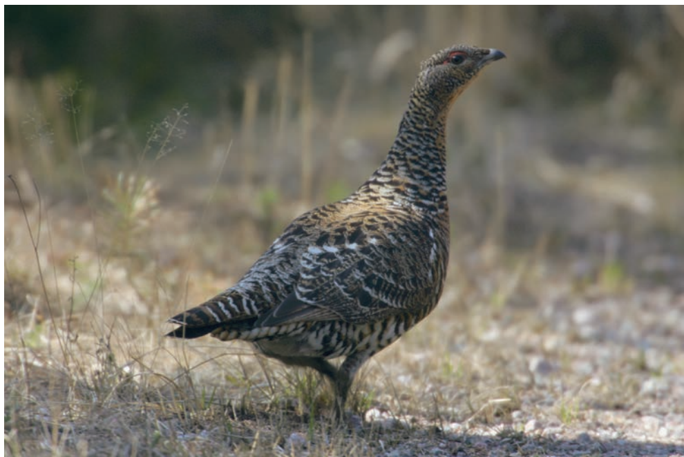
En av de arter man kan stöta på i Järlåsaskogarna – med lite tur förstås – är tjäder.

Denna vår artfattigaste årstid kan faktiskt bjuda på både det ena och det andra. Järlåsaområdet har visat sig ha stor potential vad gäller vinterfågelarter.