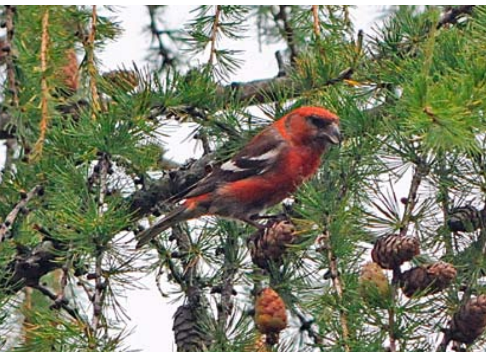
En av de fyra bändelkorsnäbbarna vid Väster-Til, Hjälstaviken 4 augusti 2008.

Under hösten 2008 visade bändelkorsnäbben ("bändeln") ganska kraftiga invasionsrörelser i Sverige, inte minst i Svealand och Götaland. Det händer relativt sällan att bändelkorsnäbbar uppträder i större antal i dessa delar av landet och senast det förekom var 2002. Denna korta text kommer att försöka beskriva invasionen under 2008, men även titta på hur denna härliga korsnäbb har uppträtt i landskapet historiskt. Min utgångspunkt har varit SOF:s årsbok Fågelåret när jag har skrivit denna text. Jag vill passa på att nämna att uppgifterna från 2008 är hämtade från Svalan och i vissa fall ännu inte är behandlade av rrk. Antalsuppgifterna kan därmed komma att se annorlunda ut i den kommande fågelrapporten. Jag vill även poängtera att uppgifterna avser landskapet Uppland, men först lite kort om arten i ett vidare perspektiv.