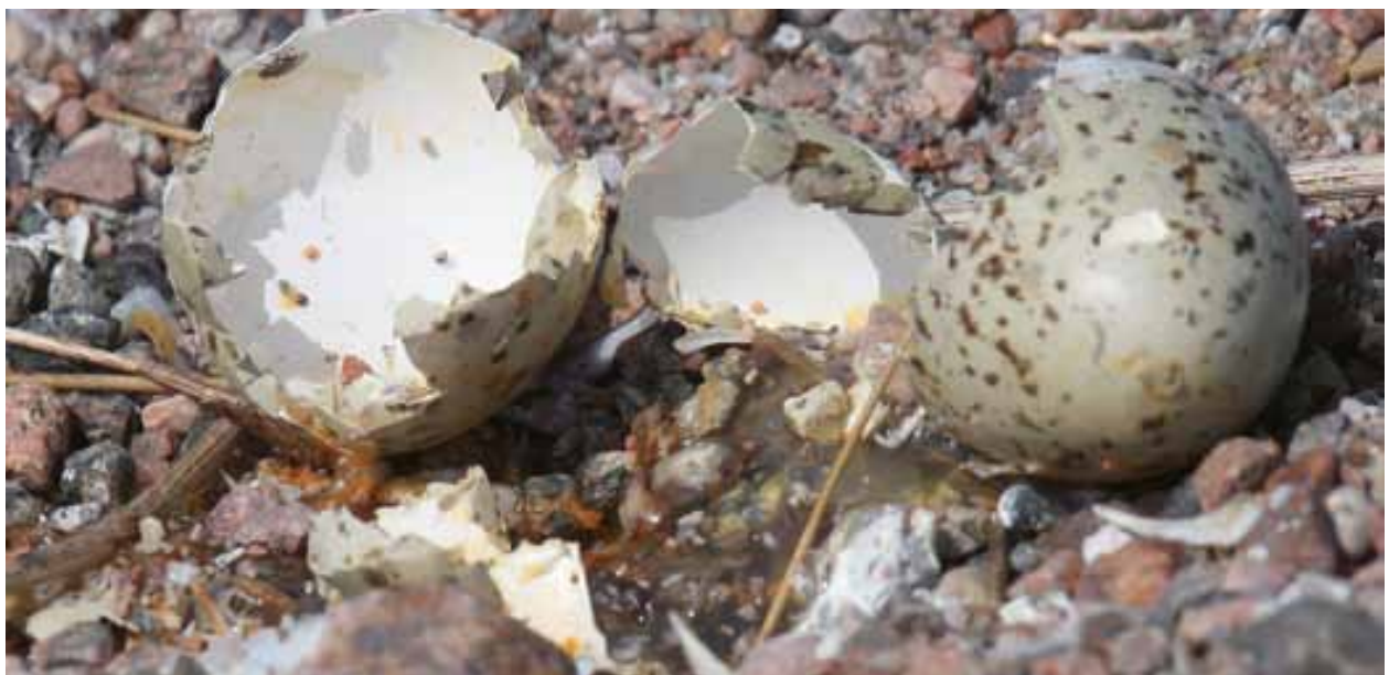
Den 14 juli 2009 mitt på dagen. Havsörnen är ganska klumpig när den prederar skrântärnebon. Den knäcker ofta äggen så att det mesta av innehållet rinner ut i gruset.

Med de iakttagelser som skett under 2010 som grund fattade Länsstyrelserna i Uppsala och Södermanland beslut om att testa en anordning för att skrämja havsörn. Två anordningar togs fram och en placerade ut i Södermanlands län och en på norra Stenarna. Skrämselutrustningen var tänkt att användas när alla tärnor var i luften och havsörnen på marken. Vidare beslutade Länsstyrelsen i Uppsala län att de två par gråtrut som häckar på den norra Stenarna skulle skjutas. Gråtrutspredation av detta slag på skrântärna är inte sedan tidigare känt från Sverige, men väl från Finland där ett gråtrutspar på Söderskär under ett år tog samtliga skrântärneungar i en koloni med 90 par skrântärnor. Dessa gråtrutar sköts under senare delen av häckningen och året efter återvände skrântärnorna som då lyckades med häckningen (Martti Hario per mail). Enligt de finska forskarna är det enskilda individer som har insett fördelarna med att äta skrântärneungar. Med dessa två åtgärder hoppades man på att kunna vända trenden med misslyckade häckningar på Stenarna. Det fanns farhågor att kolonin skulle överges om inte trenden med misslyckade häckningar kunde brytas.