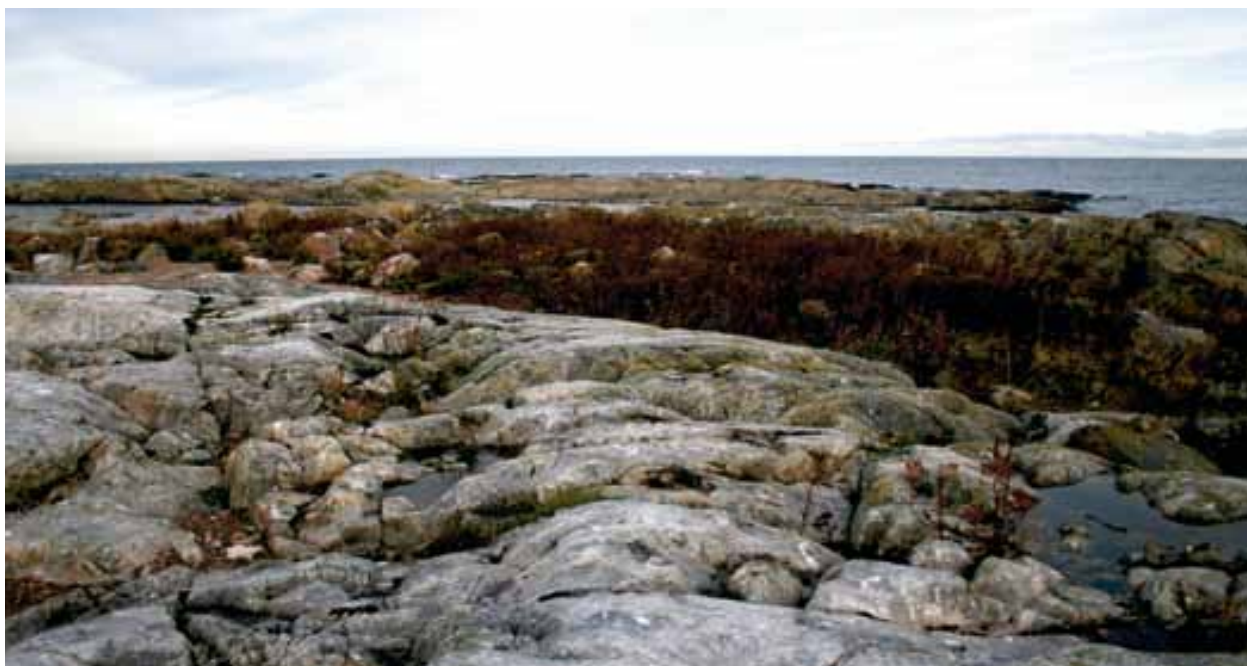
Stenarna 12 november 2007. Vy över norra delen av skrântärnekolonin på Stenarna. Tidigare var det en grusbank som täckte denna del av ön. Här låg huvuddelen av skrântärnekolonin tidigare under 2000-talet. Kolonin spriddes ut och blev mycket gles och utspridd i smågrupper under 2007 genom att det fanns så få lämpliga häckplatser för tärnorna och framförallt inga större områden lämpade för bon.

att ta sig tillräckligt nära ön och att muddra för att komma åt med en grävare var uteslutet då detta skulle kunna ändra hur ön påverkas av havet i framtiden.