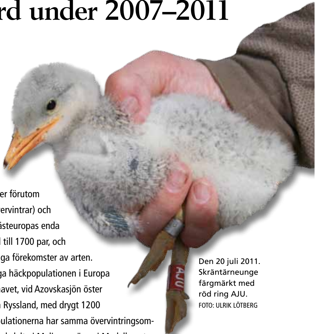
Den 20 juli 2011. Skräntärneunge färgmärkt med röd ring AJU.

Den närmaste och enda övriga häckpopulationen i Europa återfinns i nordöstra Svarta havet, vid Azovskasjön öster om Krimhalvön i Ukraina och Ryssland, med drygt 1200 par. Båda de Europeiska populationerna har samma övervintringsområden, främst vid Nigers inlandsdelta i Mali, men även i Medelhavet längs kusten i Södra Tunisien och Västra Libyen och i mindre omfattning längs Portugals och Spaniens södra kuster samt i Albanien.