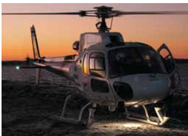
Stenarna 19 december 2007. Helikoptern, från Ostermans Helicopter i Östersund, som användes för att forsla ut 150 ton grus på två dagar till Stenarna. Här har den precis landat för att släppa av de personer som skall vara på Stenarna under dagen för att ta emot grus.

150 ton rullstensgrus till ön och anlades som de tidigare grusbankarna sett ut. Restaureringen visade sig vara mycket lyckad då hela kolonin återsamlades och flyttade till den restaurerade grusbanken under kommande häckningssäsonger.