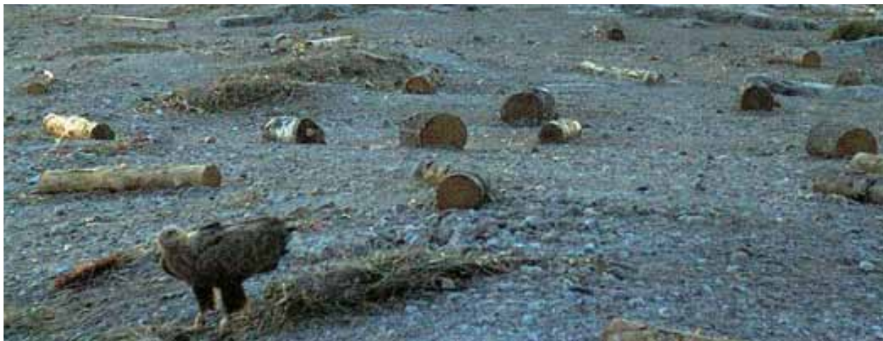
Havsörnen står vid ett skrântärnebo kl 21.45 den 7 maj 2009, se bild sid 17 för att se skrântärneboet men där det inte längre finns någon ruvande tärna vid detta bo.