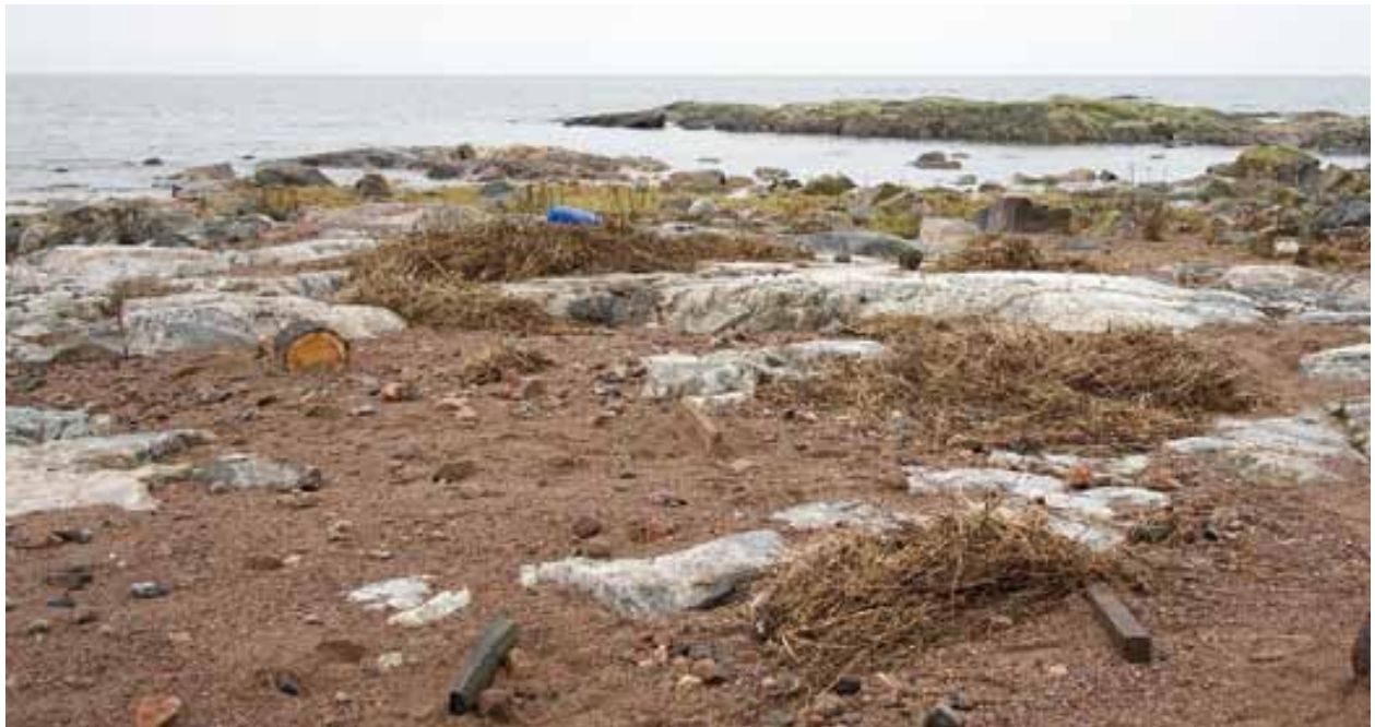
Stenarna 1 december 2008. Vy över norra delen av skrântärnekolonin på Stenarna. Den restaurerade grusbanken dit skrântärnorna flyttade ihop till en samlad koloni under 2008. Samma vy som bild på sid 15.