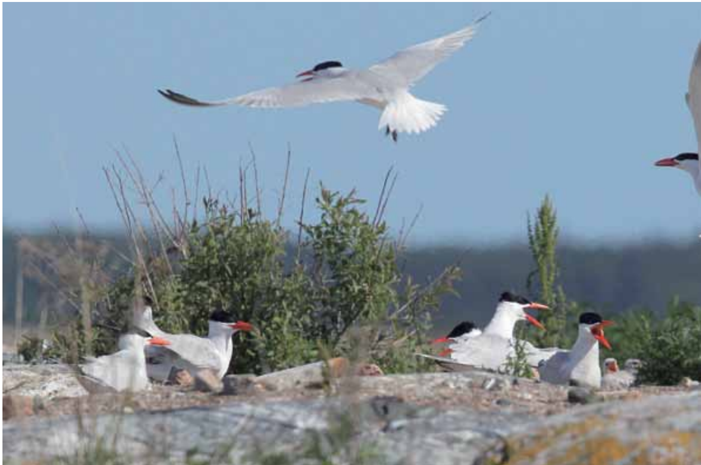
Den 27 juni 2011. Återigen en normal häcksäsong på Stenarna. Knappa 100-talet ungar beräknas ha blivit flygga.

tidigare noterats skräntärneungar som blivit flygga först i september.